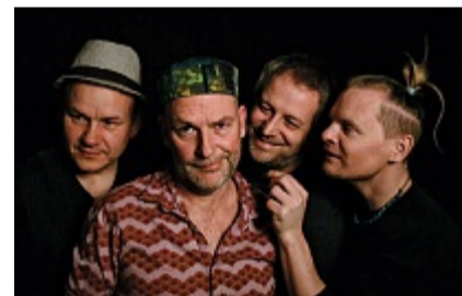
Stilmässig kaum einzuordnen: die vier Musiker von «Supersiech».

Freitag, 7. Juni (20 Uhr): Konzert mit «Supersiech». Schloss Neu-Bechburg, Oensingen. Freier Eintritt, Kollekte.