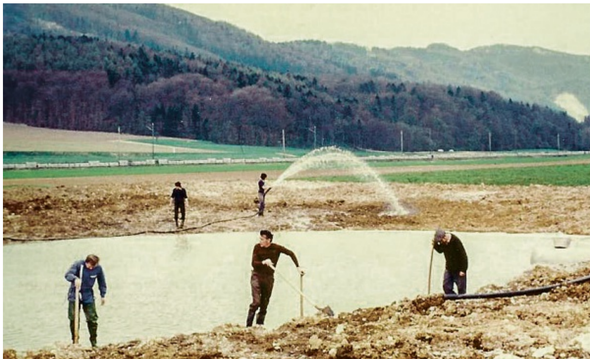
Auf Worte folgten Taten: Mitglieder des Natur- und Vogelschutzvereins packen in den 1970er-Jahren bei der Erstellung des Biotops bei der ARA Falkenstein in Oensingen an.