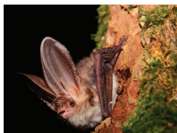
Braunes Langohr