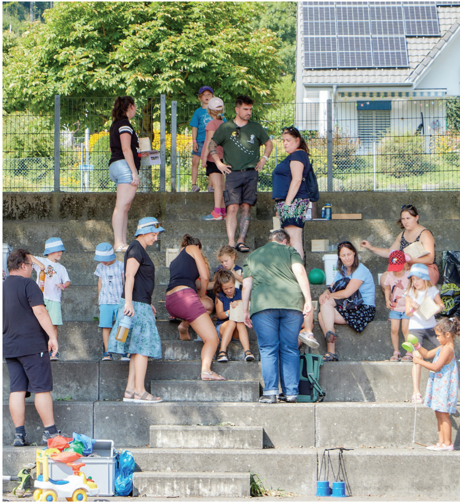
Reges Interesse am Insektenhotel-Workshop