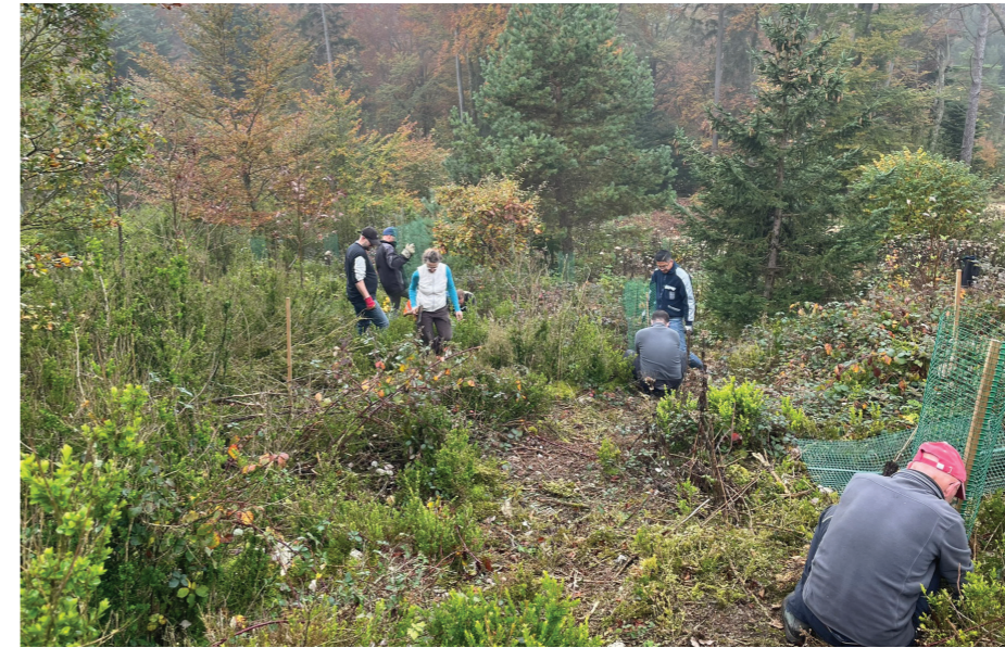
Tatkräftiger Einsatz der Teilnehmenden

Der Natur- und Vogelschutzverein Oensingen spielte eine wichtige Rolle bei der Integration von Massnahmen zur Förderung der Biodiversität in der Überbauung Blumenhof. In enger Zusammenarbeit mit den Architekten wurden Nistkästen für verschiedene Vogelarten sowie Mikro-Oasen mit Steinhäufen und Asthaufen angelegt, um Unterschlupfmöglichkeiten für kleine Tiere zu schaffen. Zudem wurde auf die Pflanzung einheimischer Gehölze geachtet, um die lokale Flora und Fauna zu unterstützen. Diese Massnahmen tragen dazu bei, die Biodiversität zu fördern und die Lebensqualität in der Gemeinde zu steigern.