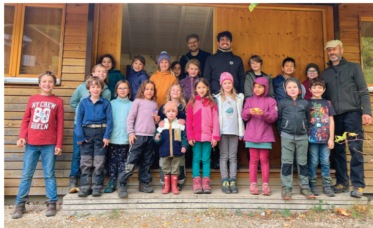
Beringungsstation Subigerberg SO, 9. Oktober 2024